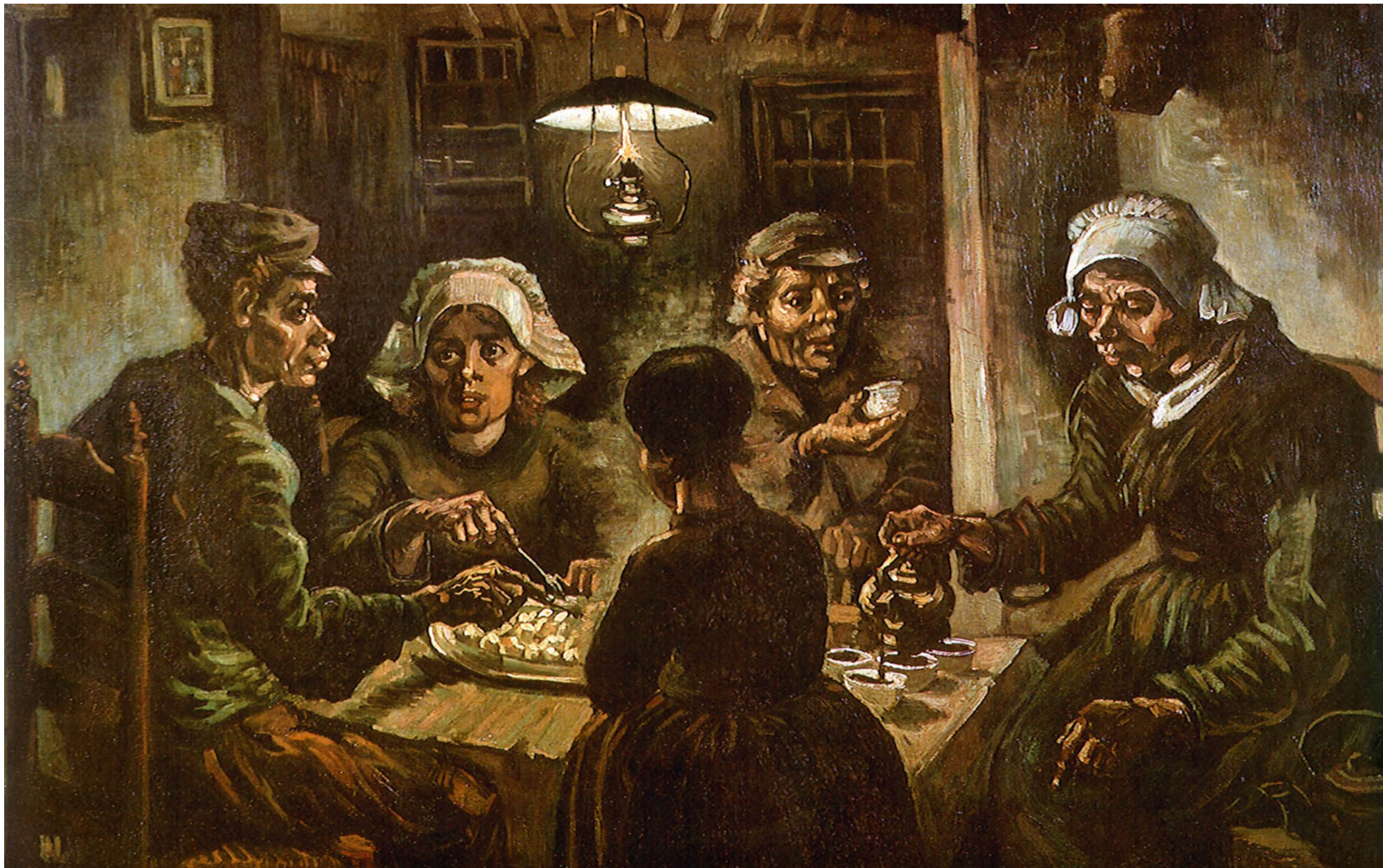
IMMAGINE SCHEDA 4 A “I mangiatori di patate” – olio su tela (1885) di Vincent Van Gogh – Museo Van Gogh – Amsterdam [Olanda]