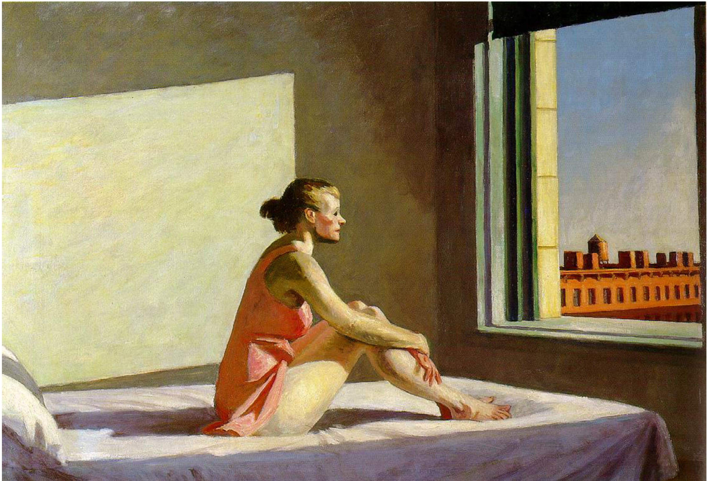
IMMAGINE SCHEDA 3 A "Morning sun" (sole di mattina) – olio su tela (1952) di Edward Hopper – Columbus Museum of Art – Columbus, Ohio [USA]