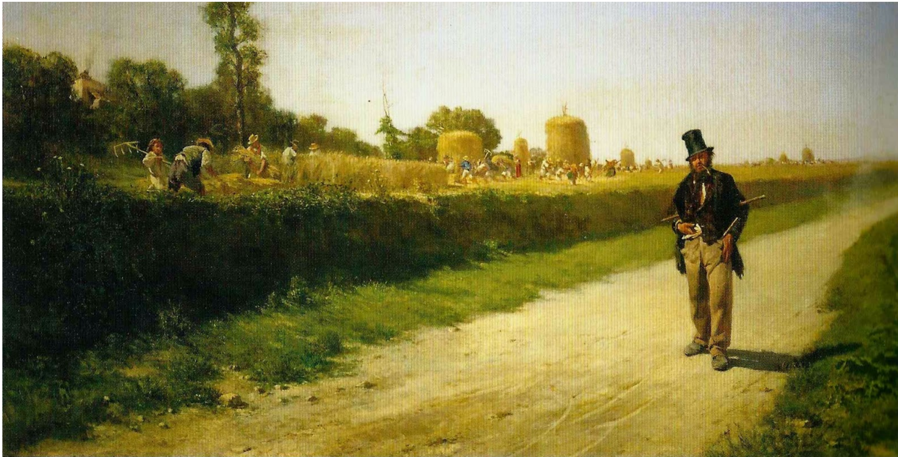
IMMAGINE SCHEDA 4 B “Ozio e lavoro” – olio su tela (1863) di Michele Cammarano – Museo Nazionale di Capodimonte – Napoli [Italia]