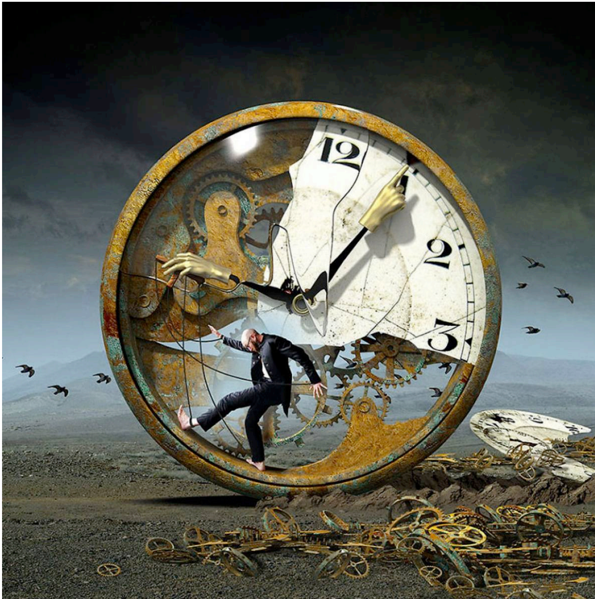
IMMAGINE SCHEDA 1 A Copertina del disco “Live at Koko” – illustrazione digitale (2014) di Igor Morski per il gruppo musicale “Uriah Heep” [Regno Unito]