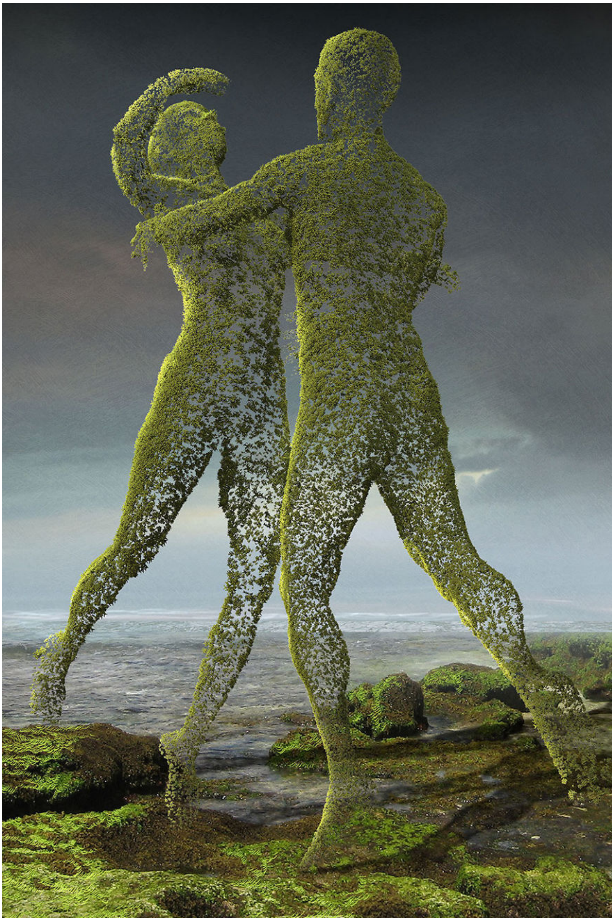
IMMAGINE SCHEDA 5 B "Eko dance" – illustrazione digitale di Igor Morski – [Polonia]