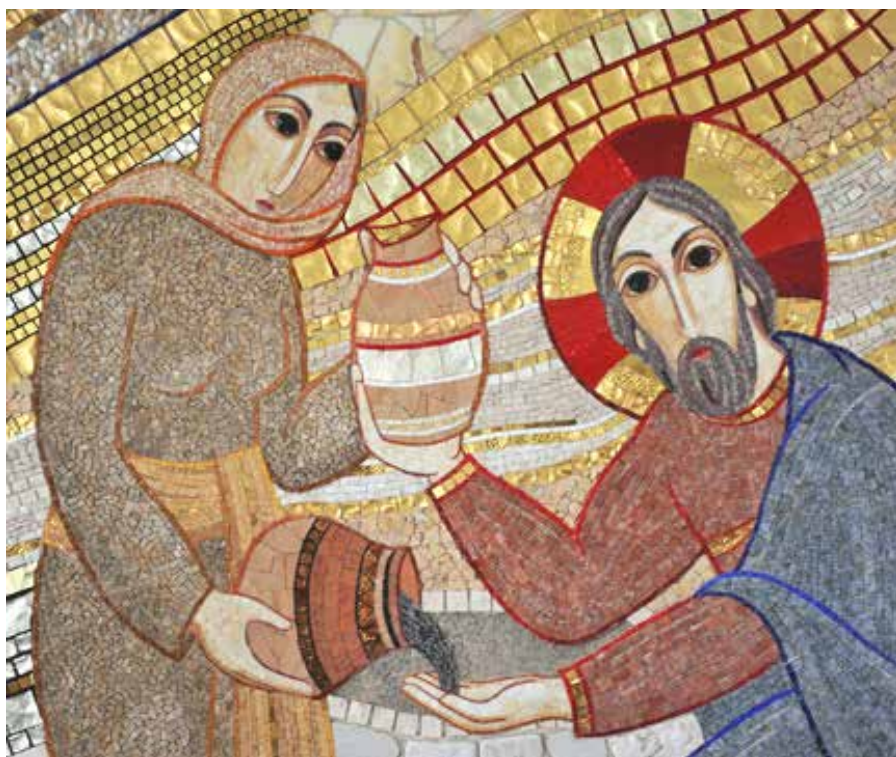
“Cristo con la samaritana” – mosaico (2009) di Marko Ivan Rupnik Cappella delle Suore orsoline – Ljubljana (Slovenia)