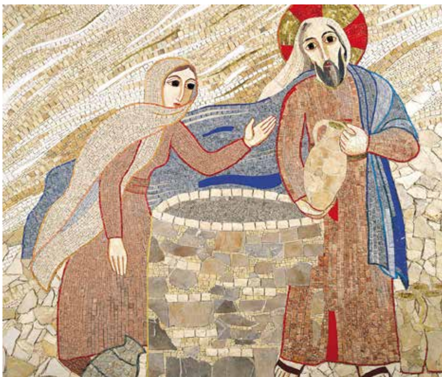
“Gesù con la samaritana al pozzo” – mosaico (2006) di Marko Ivan Rupnik Cappella della “Casa incontri cristiani” – Capiago (Italia)