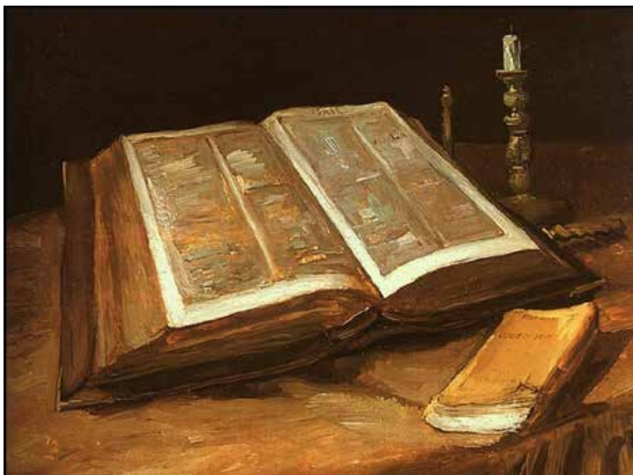
“Natura morta con Bibbia” – dipinto olio su tela (1885) di Vincent Van Gogh Van Gogh Museum – Amsterdam (Olanda)