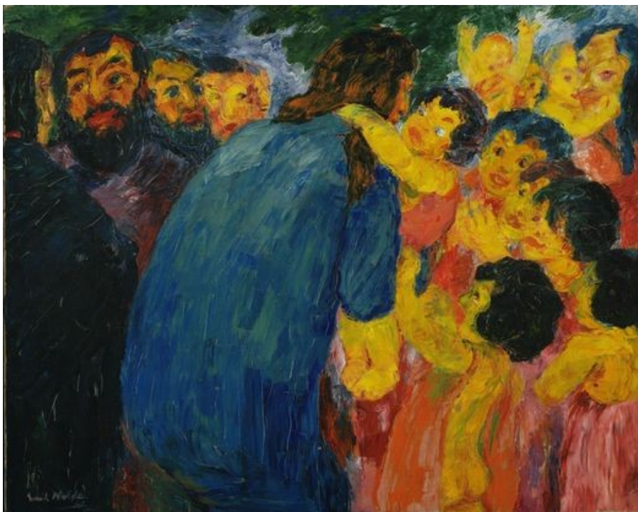
“Gesù e i bambini” – dipinto (1910) di Emil Nolde The Museum of modern art – New York (USA)